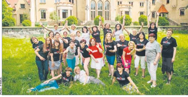
♦ Biblioteka w Jarocinie jest perelką - nie tylko architektoniczną

Biblioteka w Jarocinie podkreśla, że nieobce są jej nowe technologie, czego przykładem jest tegoroczna aplikacja mobilna „Legodczytacz na szlaku”. Jej współtwórcami są dzieci, które odkurzyły stare, lokalne legendy, nadając im nowoczesną formę podczas spotkań warsztatowych. Aplikacja w formie interaktywnej mapy adresowana jest do