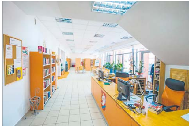
♦ Czytelnicy chwalą nową siedzibę Biblioteki w Sianowie

– W naszych bibliotekach powstają kąciki crossbookin-