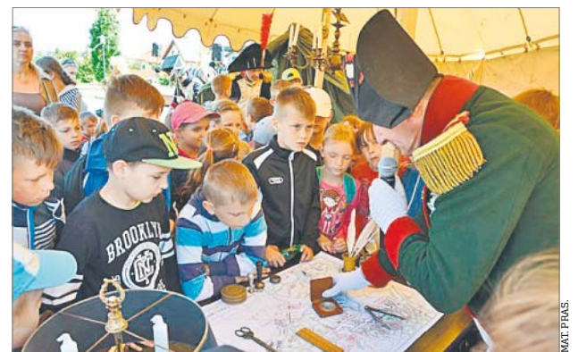
♦ Biblioteka w Świątkach organizuje wiele ciekawych projektów

– Jednym z ostatnich działań tego koła była realizacja projektu „Na Szlaku Napoleońskim – 210. rocznica pobytu